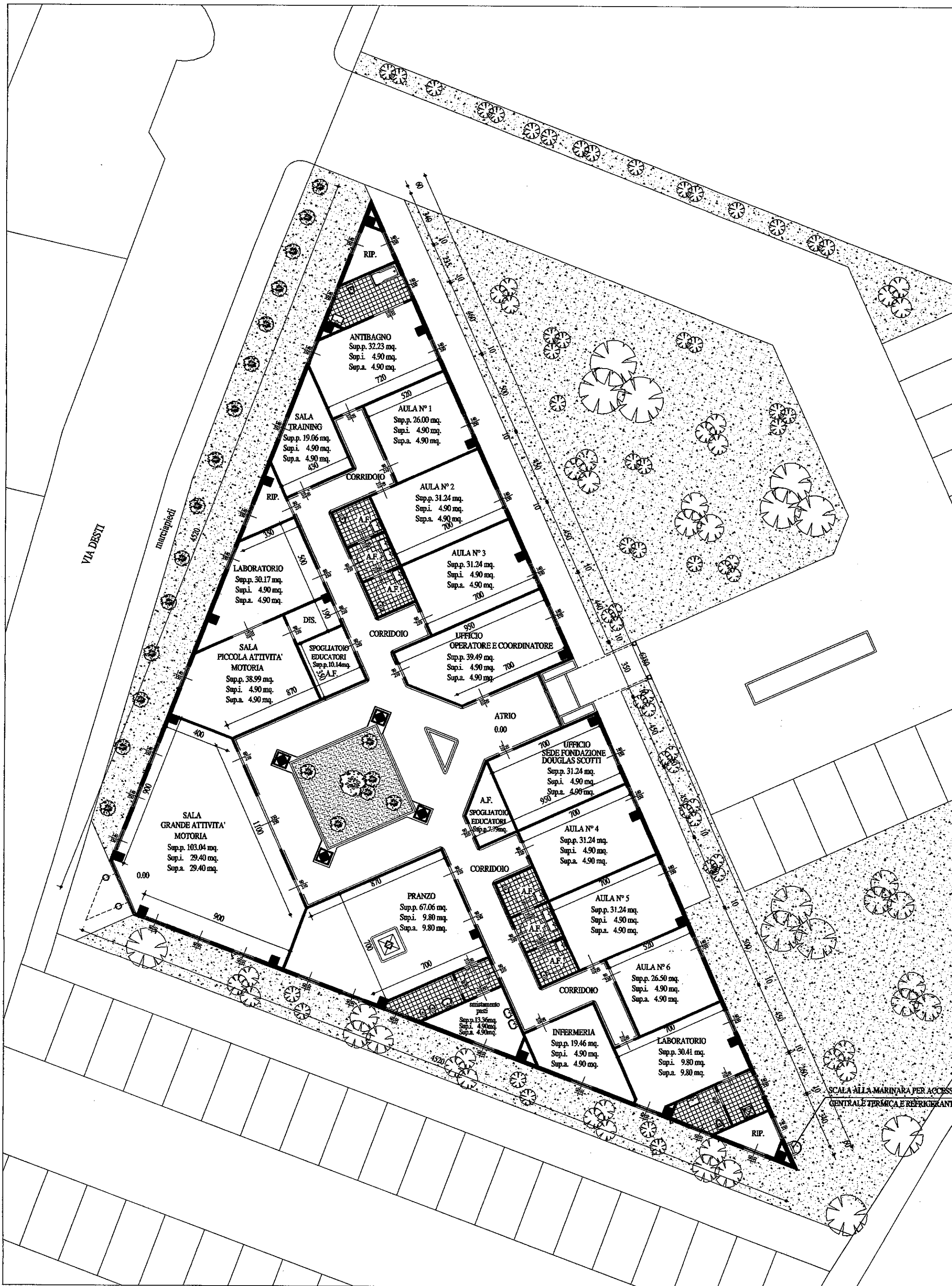
PLANIMETRIA PIANO TERRA